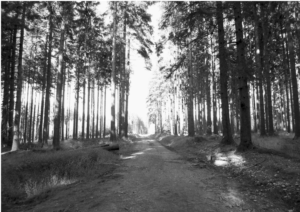
Foto: Römerstraße östlich von Belginum

Die im 1. Jhdt. n. Chr. ausgebaute Ausoniusstraße (Via Ausonia), ihre Ursprünge liegen in vorrömischer Zeit, verband die Metropolen Trier und Mainz. Sie wurde im Mittelalter nach dem römischen Dichter und Staatsbeamten Decimus Magnus Ausonius benannt, der sie im 4. Jhdt. anlässlich seiner Rückkehr von einem Alemannenfeldzug ausführlich beschrieb. Die Reiseschilderung bildet den Anfang der „Mosella“, seinem gepriesenen Loblied auf Fluss und Landschaft im Umfeld der Kaiserstadt.