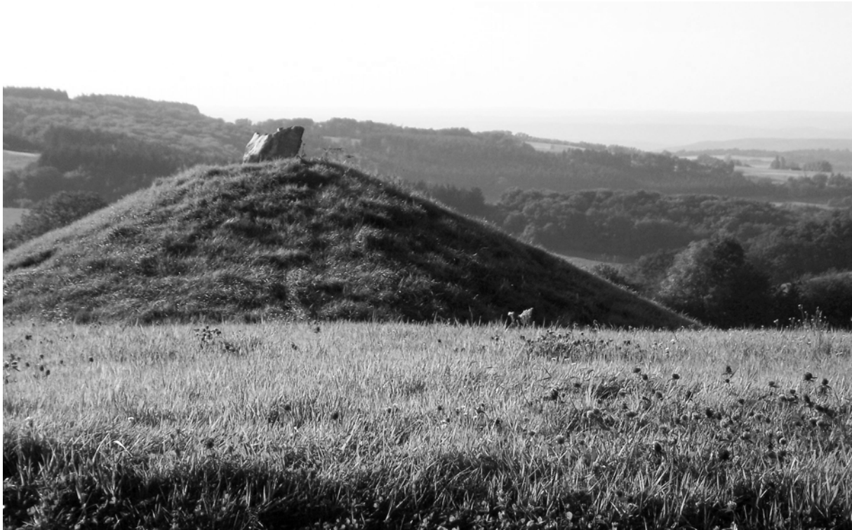
Foto: Grabhügel der Nekropole

An der Römerstraße von Trier nach Bingen, der später sogenannten Ausoniusstraße, wurde im 1. Jhdt. n. Chr. der Vicus Belginum am Kreuzungspunkt alter historischer Verkehrswege angelegt. Die keltische Vorgängersiedlung ist noch nicht aufgefunden worden.